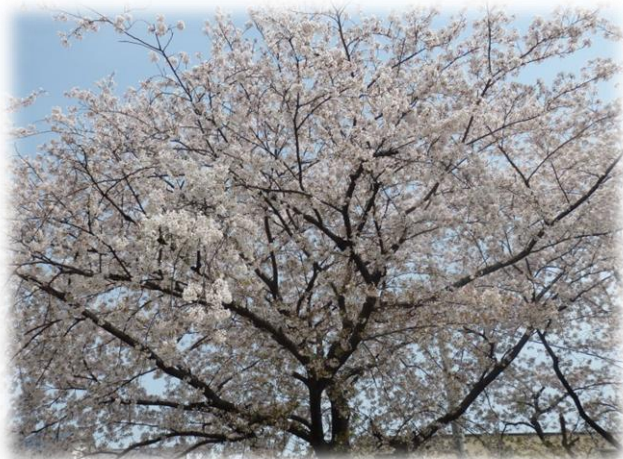
吉岡公園や香流川、城山公園でお花見