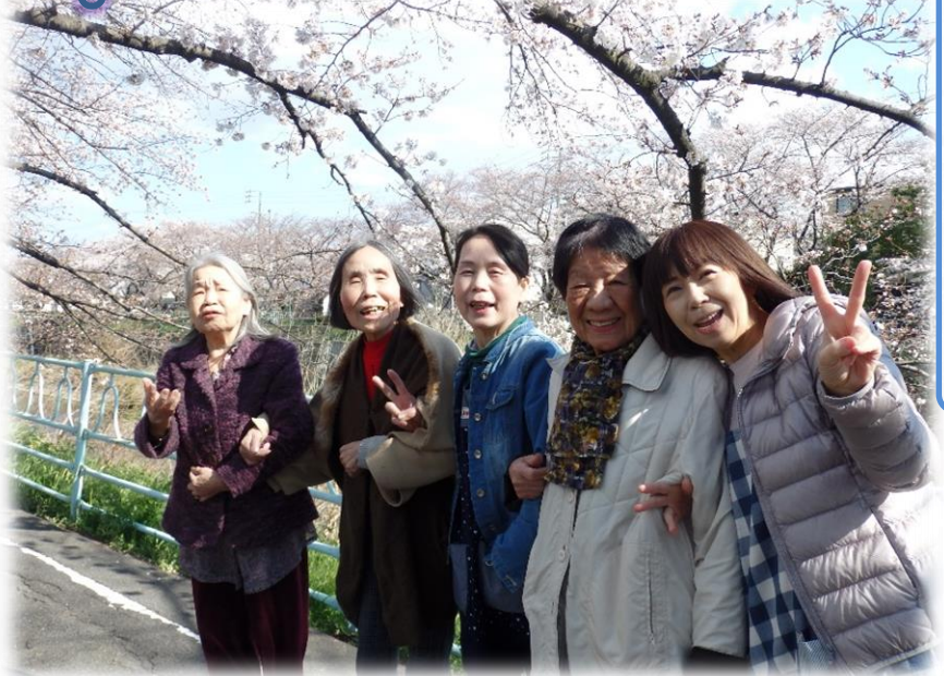
まんまの皆様にも満開の笑顔の桜が 味き誇っていますよ〜♪♪