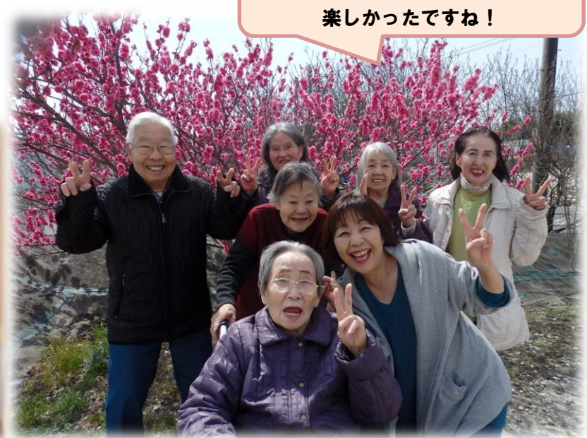
満開のお花の前で「はいっチーズ！」 楽しかったですね！