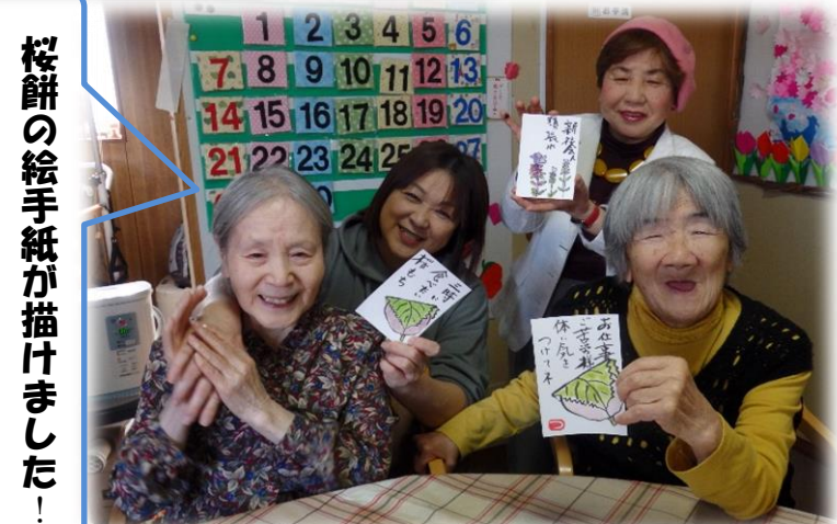
桜餅の絵手紙が描けました！